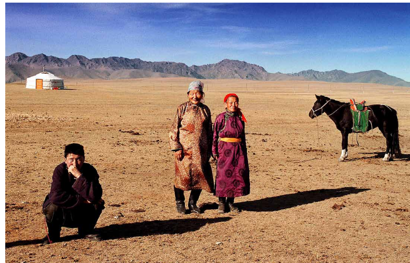
På stäppen i Mongoliet – från ett reportage om FN:s UNDP-organisation.