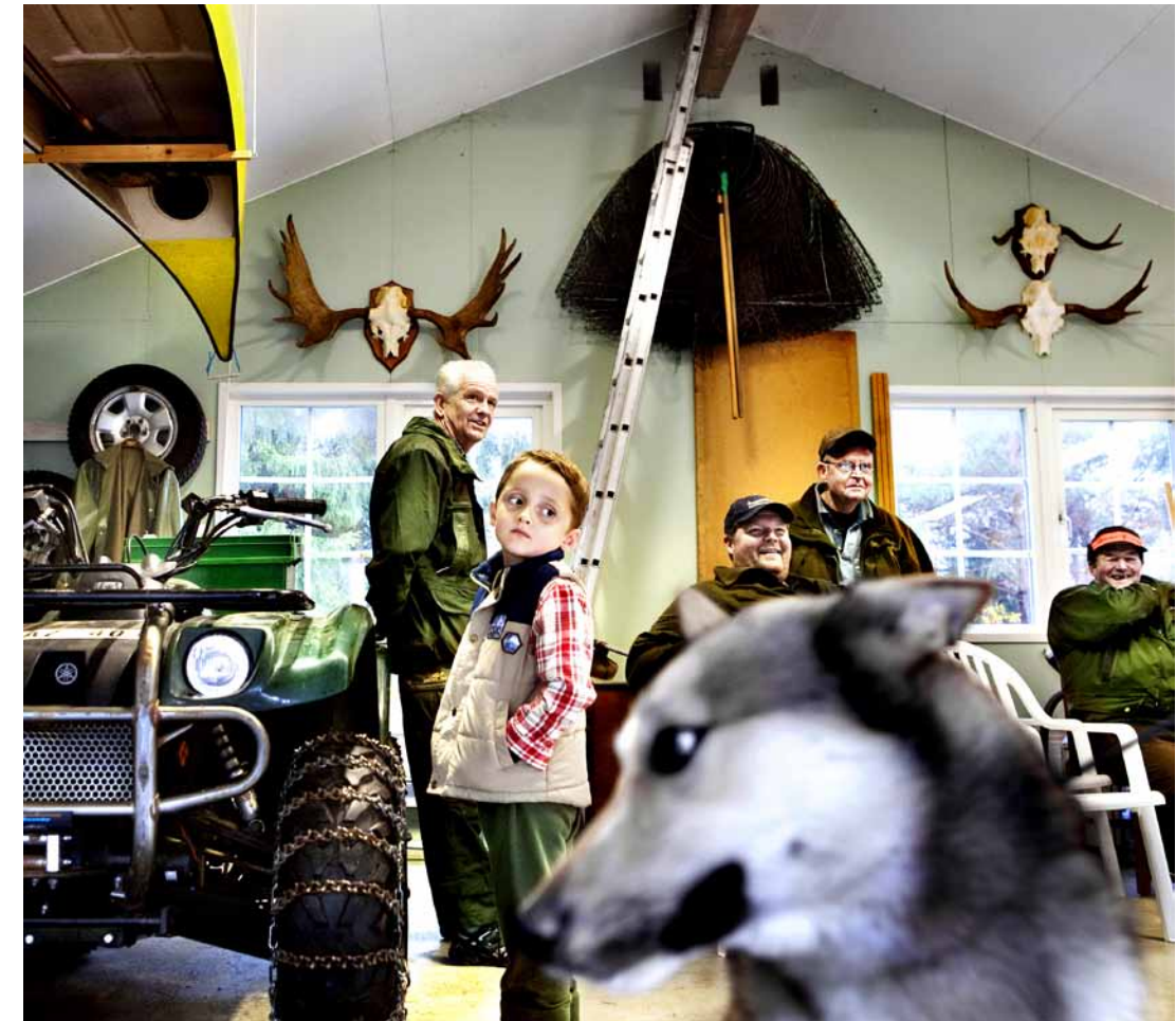
Inför älgjakten i Öjersjö. En av de nominerade bilderna i Årets Bild 2009 i nya klassen «Folkets bild».

Du verkar vara väldigt bra på att skapa kontakt med människor när du jobbar. Är det viktigt att tycka om människor?