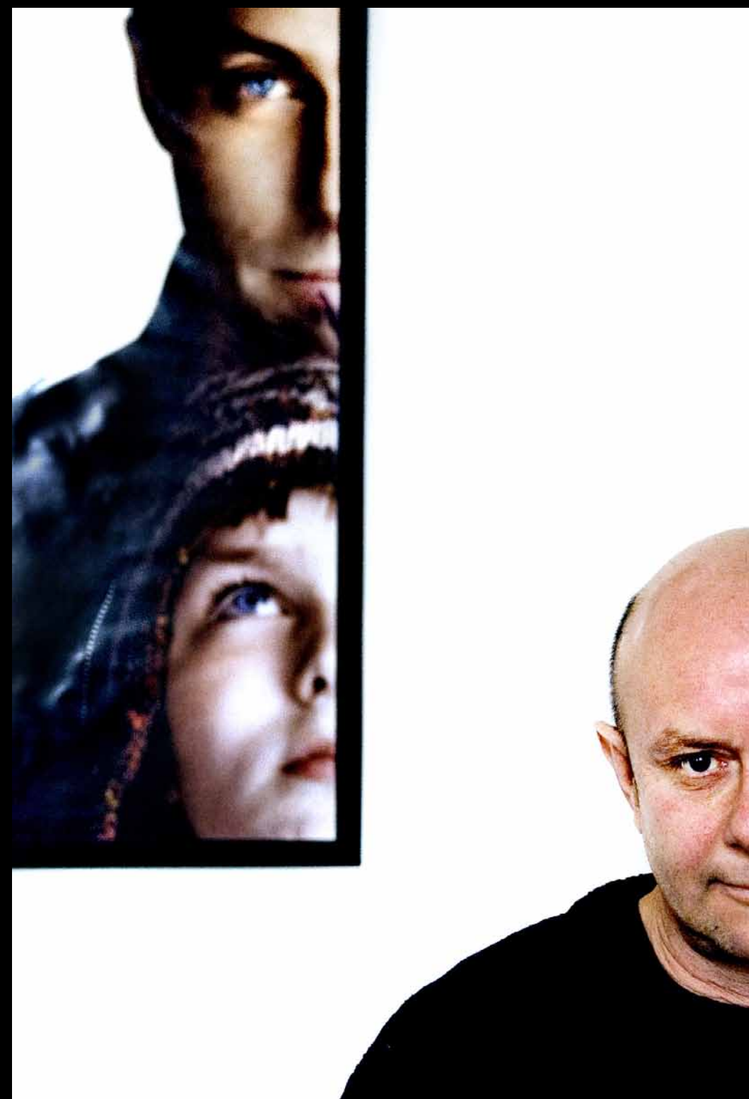
Författaren Nick Hornby i sin skrivarlya i London.

– Ofta är vi fotografer på plats vid fel tillfälle. Tillfället kanske är bra för en intervju men inte för foto. Om en artist till exempel släppt en skiva träffas man ofta på ett café, men vi fotografer borde i stället vara med när de repar eller packar väskor. Tyvärr måste vi trola med knäna många gånger – bildtillfället är fel men vi får se till att hitta en snygg vinkel, ett schysst ljus, en bra komposition och ett bra uttryck på den som ska fotograferas.