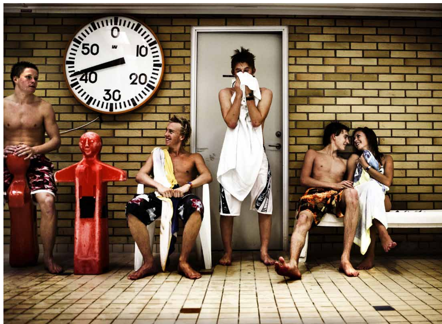
Från ett reportage om Valhallabadet. Från början ett eget projekt som utvecklades till ett nyhetsreportage och bildspel.